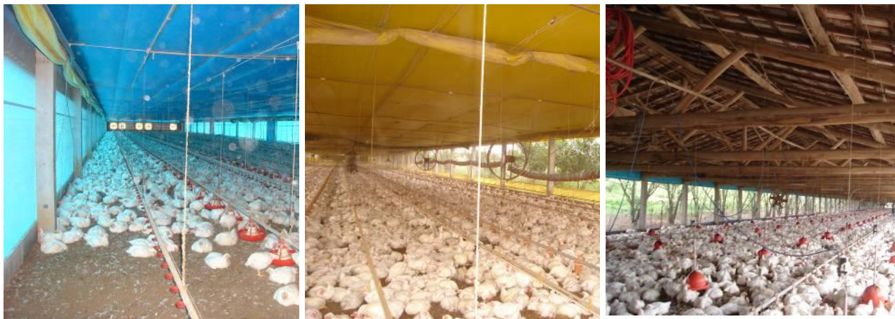
Figura 1 – Galpão de pressão negativa, com alto controle de climatização, seguido por galpão de pressão positiva; com sistemas de ventilação mínima e, por fim, galpão sem forro e sem controle de ventilação.

Além das visitas apresentarem rotinas de inspeção, as instalações foram fotografadas e as informações requisitadas aos técnicos foram relacionadas às seguintes características: